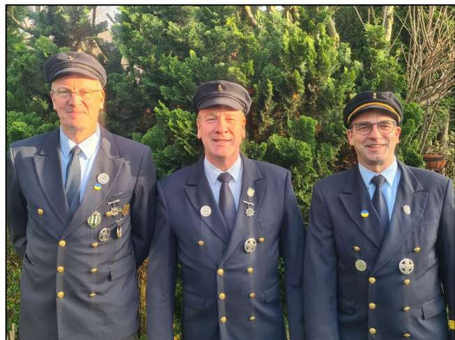
Minister Michael Bihn