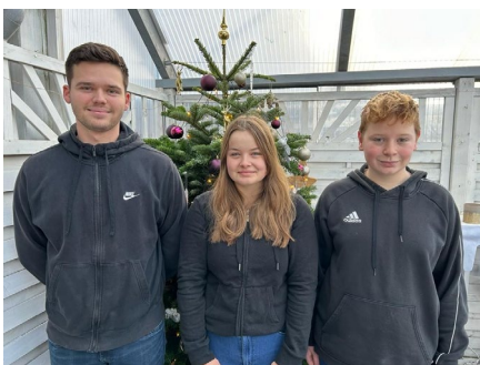
Minister Jungkönigin Minister Lukas Chiara Moritz Schiffer Sudkamp- Nauschütz Calka