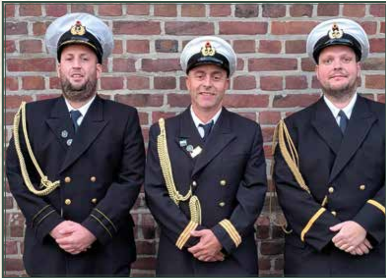
Minister Christian Küppers, König Oliver Weißbach Minister Jens Hirschelmann